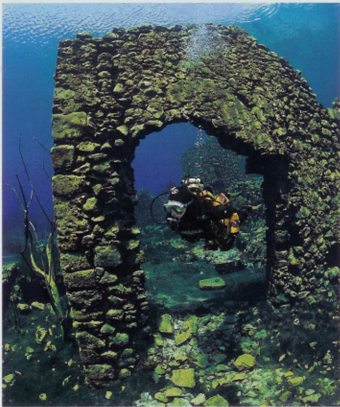
Een duiker tussen de muren van een molen. Als je in de nederzetting zelf duikt, moet je wel goed je drijfvermogen beheersen.

Geen moeilijke duik met meer dan fantastisch zicht.