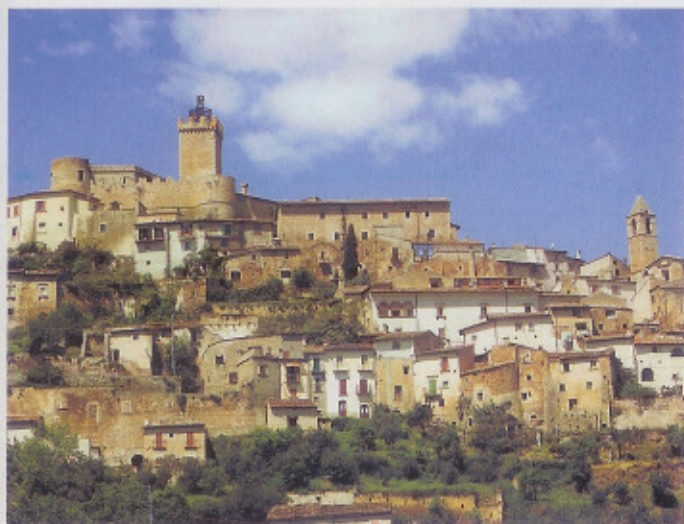
Het plaatsje Capestrano kijkt uit over het Lago di Capo d'Acqua.