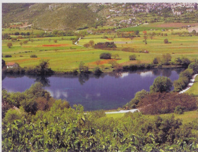
Geen bergmeer: het meer ligt op een hoogte van 300 meter.