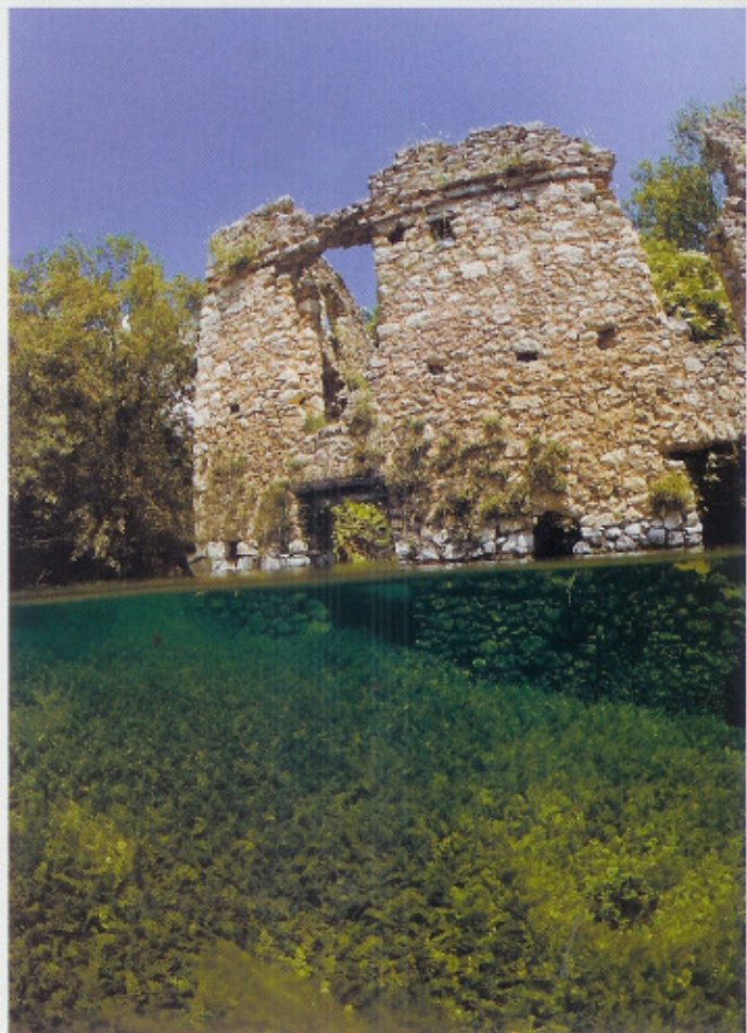
De muur van dit gebouw komt boven het wateroppervlak uit.

We zwemmen vervolgens onder bruggen door. «De enige eis die het Lago di Capo d'Acqua aan duikers stelt, is dat ze goed trimmen. Zeker als ze onder bruggen door zwemmen of tussen de vervallen gebouwen en torens door gaan.» En dat hij gelijk heeft, blijkt wel als