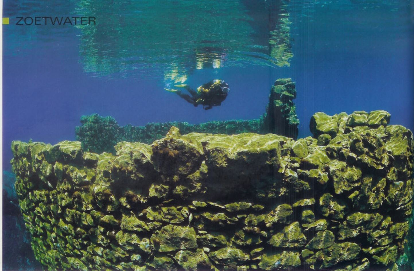
De muren van de molen raken haast het wateroppervlak.

We zwemmen eerst naar een molen. Althans wat er van over is gebleven. Steen voor steen met de hand gebouwd staan de muren als een relict uit lang vervlogen tijden op de bodem. Een paar afgestorven bomen en wortels, die in het koude water geconserveerd zijn gebleven, maken het mystieke, onwerkelijk overkomende plaatje compleet. Een plaatje dat opvalt door het schone en heldere water. We kunnen oneindig ver kijken. Geen vis, geen leven, geen beweging, helemaal niets leidt ons af. De muren, waar je volgens Dante vooral niet tegenaan moet leunen vanwege instortingsgevaar, en de bodem zijn spaarzaam begroeid met diverse algen.