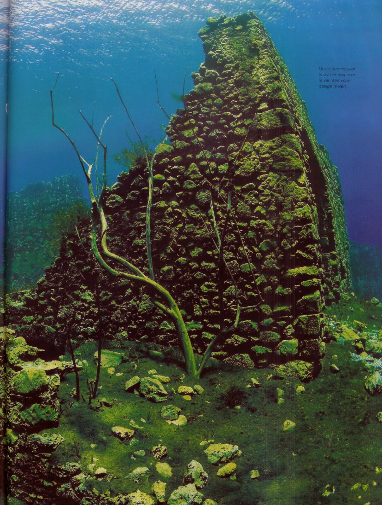
Deze steenheuvel is wat er nog over is van een voor- malige molen.