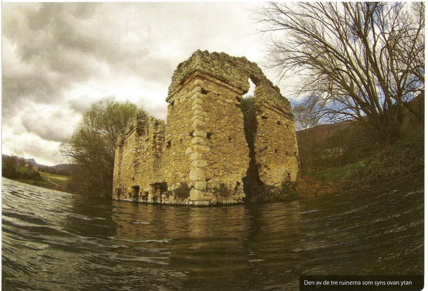
Den av de tre ruinerna som syns ovan ytan

I nternationalparken Gran Sasso e Monti della Laga cirka 18 mil öster om Rom intill den lilla antika staden Capestrano ligger sjön Lago di Capo D'Acqua. Sjön bildades på 1950-talet när man skapade en fördämning för att distribuera vatten till odlingar i trakten. När man närmar sig platsen ser det på ytan ut som vilken sjö som helst. Bara en ruin i strandkanten skvallrar om att det finns något speciellt under ytan. I det kristallklara vattnet som kommer från underjordiska källor finner man rester av byggnader från medeltiden.