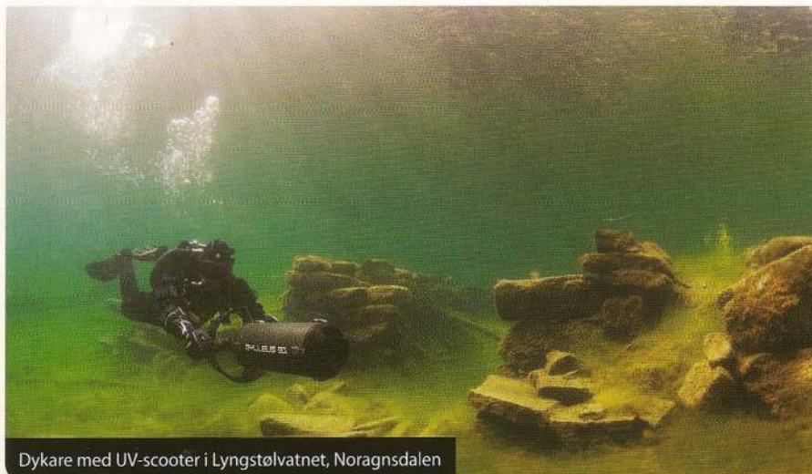
Dykare med UV-scooter i Lyngstølvatnet, Norangsdalen

Miljön under ytan påminner en hel del om den Italienska sjön och båda sjöarna är ungefär lika djupa. De har även båda två bildats av fördämningar även om den i Norangsdalen inte var avsiktlig.