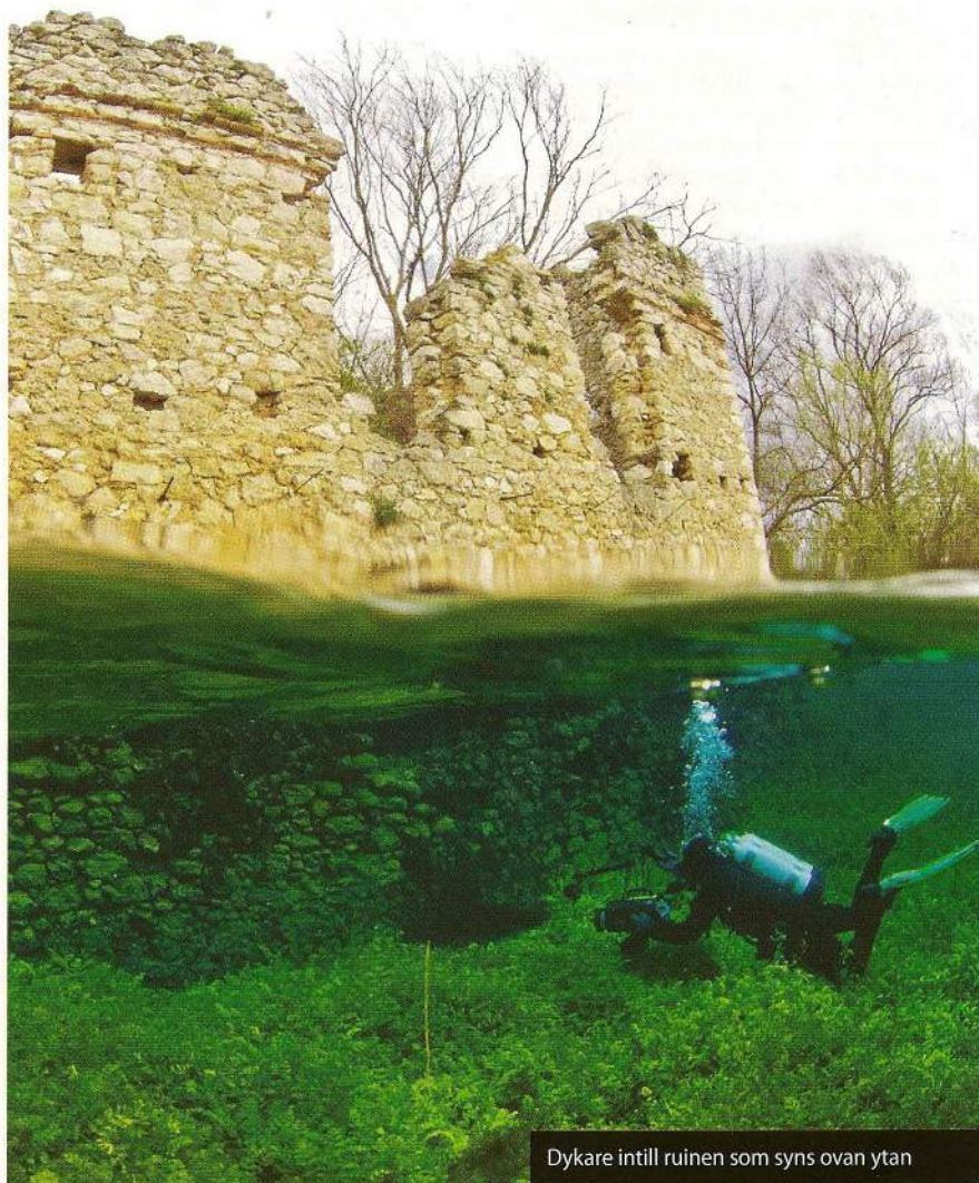
Dykare intill ruinen som syns ovan ytan

Man kommer till sjön genom att ta väg 655 upp mot dalen från Hellesylt som ligger i Møre og Romsdal fylke. Det går att köra bil ända fram till strandkanten och enklast är att ta sig dit är ifrån en rastplats intill sjön. ■