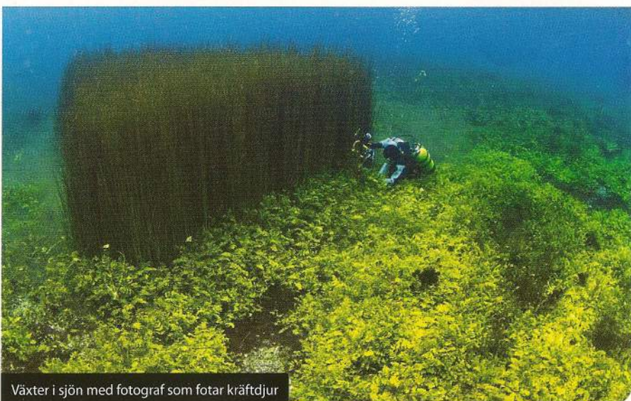
Växter i sjön med fotograf som fotar kräftdjur