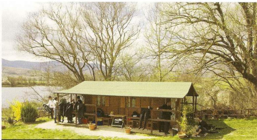
Dykklubben Atlantides lokal intill sjön

Efter att ha simmat runt och fotat anläggningen en bra stund, känns det som vi har sett det mesta. Nu tar vi oss tillbaka mot stranden och på vägen stöter vi på två dykare som sitter på botten