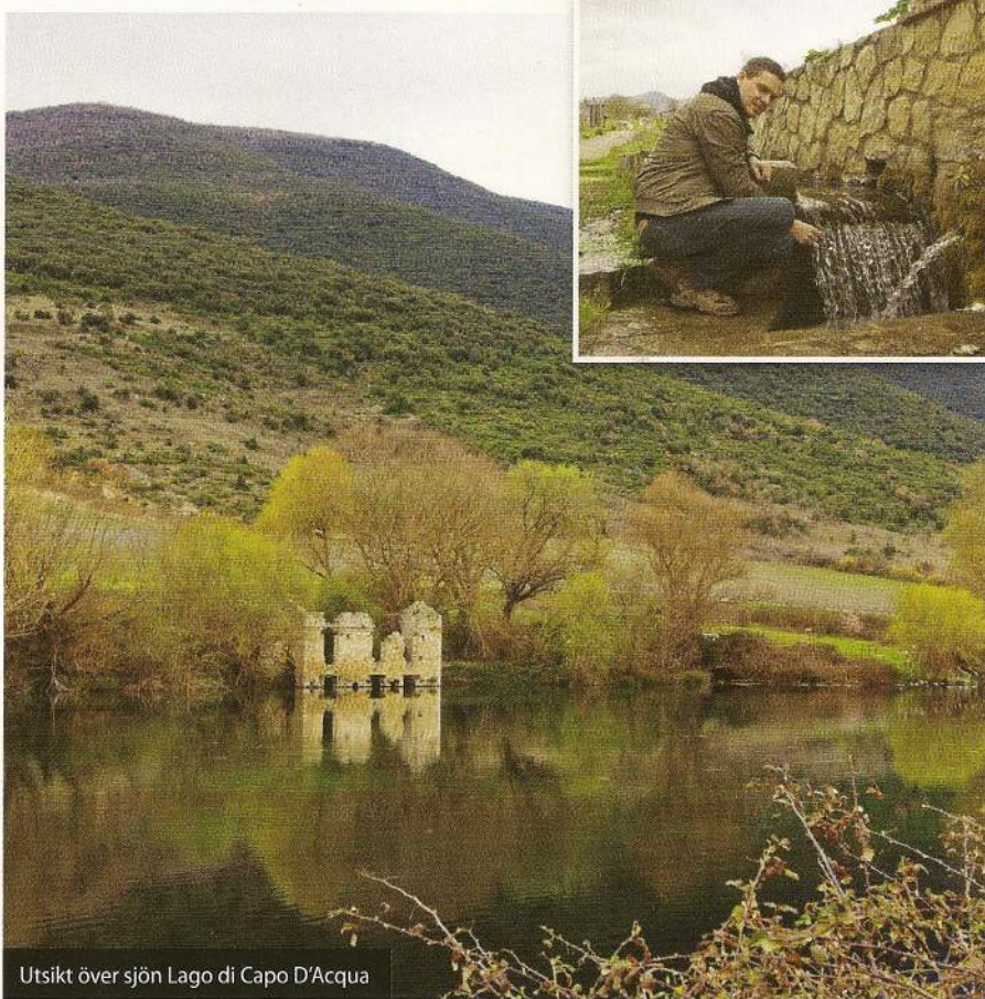
Utsikt över sjön Lago di Capo D'Acqua