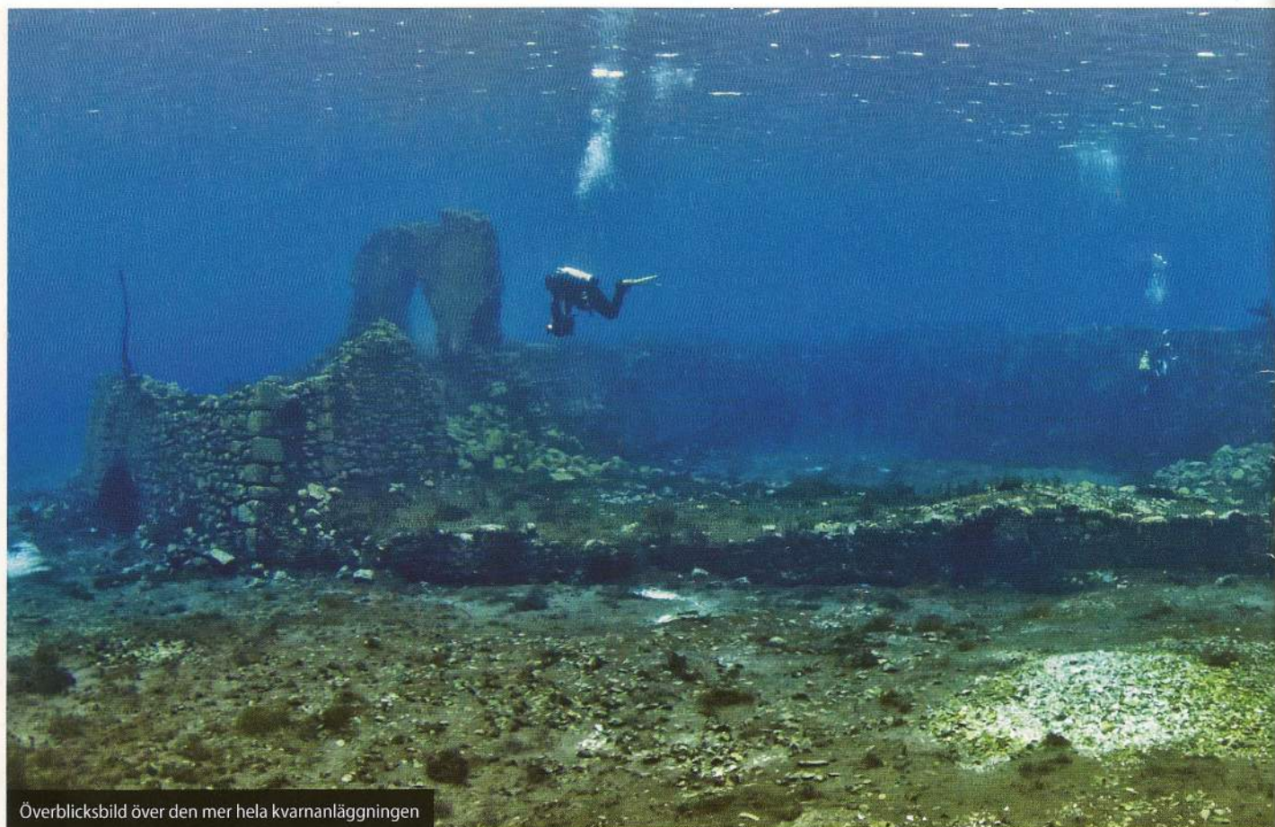
Överblicksbild över den mer hela kvarnanläggningen

med sina kamerariggar intill något som ser ut som vassruggar. Dessa små vassruggar växer på lite grundare djup närmare stränderna. Jag får senare veta att sjön även är utmärkt för supermacro-fotografering och inne i vassen lever bland annat små kräftdjur som är tack-samma fotomotiv. Förutom den unika växtligheten och kräftdjuren finns det ganska gott om öring i sjön.