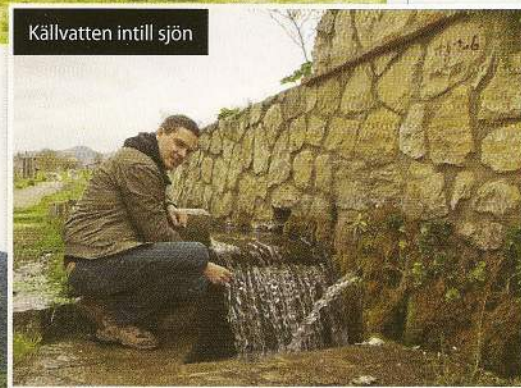
Källvatten intill sjön